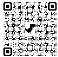
申し込みフォーム